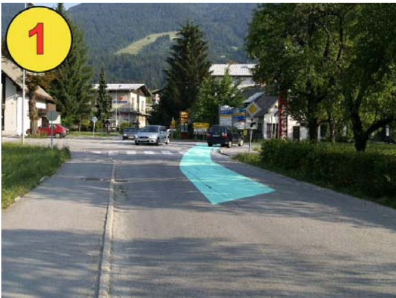
Foto 1- In Bohinjska Bistrica nach rechts fahren